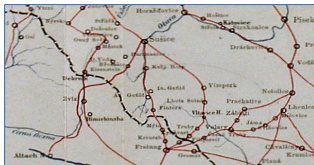
Zdroj: Mapa zemských stezek v království českém

Stezka bude pěší, opticky rozdělená do jednodenních úseků, bude proto motivací k ubytování a stravování v regionu, kudy bude procházet. Svazek SOSP (Jihočeský kraj) spolu s DSO Prácheňsko (Plzeňský kraj) budou o úpravě tras jednat.